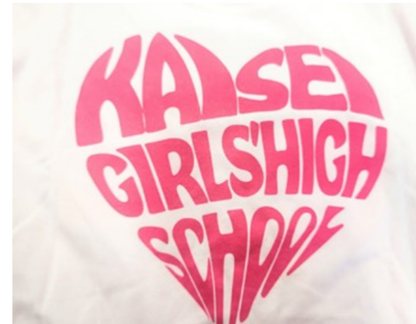
【海星祭Tシャツのデザイン】

みんなで心をつなげて思い出に残る海星祭を作り上げることができたのも多くの方のご協力とご支援があったからこそだと思います。そして神さまが私たちを見守ってくださった一日に、心から感謝いたします。