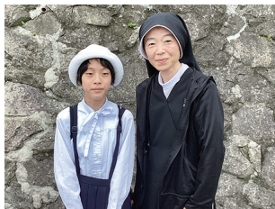
外海・出津教会にて

学で教鞭を取っていたシスターだったことも判明し、娘が訪れる先々は実は私にも繋がっていたことに、神のお導きを感じずにはいられません。充実した体験をさせて頂いた先生方には、心から感謝をする日々です。